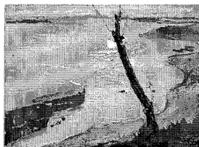
Dņepra pie Kaņevas.

Vēl mācoties akadēmijā, kādā no vasaras gleznošanas praksēm, viņa un vēl daži studenti devās uz Kijevu un pēc tam uz vietu vārdā Kaņeva. Turienes daba mākslinieci iedvesmojusi daudziem interesantiem darbiem gan tad, gan arī vēlāk. Daudzus savus darbus viņa gleznoja pēc dabā gleznotām skicēm. Viņa mēdza izmantot arī senas skices, vai to fragmentus savos vēlāk radītajos darbos. Pēc