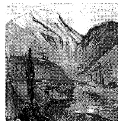
Kaukāza kalni, I.

Personālizstādes viņas dzīves laikā bijušas tikai divas – viena Zinātņu akadēmijā, otra bijušajā Centrālajā poligrāfiķu klubā Rīgā (Lāčplēša ielā 63). Mākslinieces piemiņai veltītā izstāde tika rīkota 1981. gadā Dubultos, Jūrmalas vēstures un mākslas muzejā.